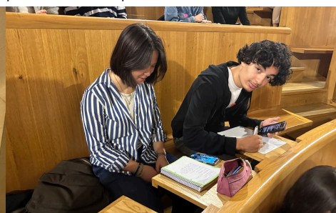
"EN PLEINE PREPARATION DE LEUR ORAL."